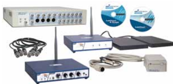
Базовый комплект телеметрической системы ML880B107 для регистрации активности СНС и давления